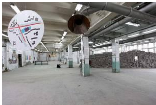
Экспозиция основного проекта. Здание типографии «Уральский рабочий».

Организатор: Екатеринбургский филиал Государственного Центра современного искусства